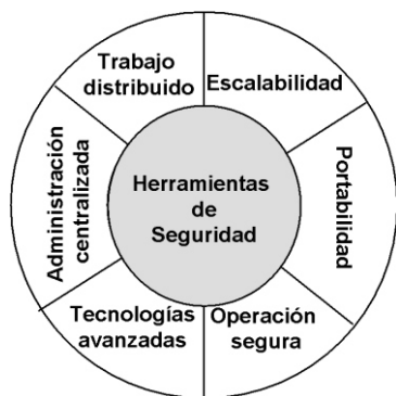
Figura 2. Requerimientos de las herramientas de seguridad para NGN.

El reto de la seguridad en las NGN implica contar con herramientas (fundamentalmente cortafuegos, IDS, IPS, FMS, antivirus y sus combinaciones) que incluyan en sus diseños determinados requerimientos, explicados brevemente a continuación (Figura 2):