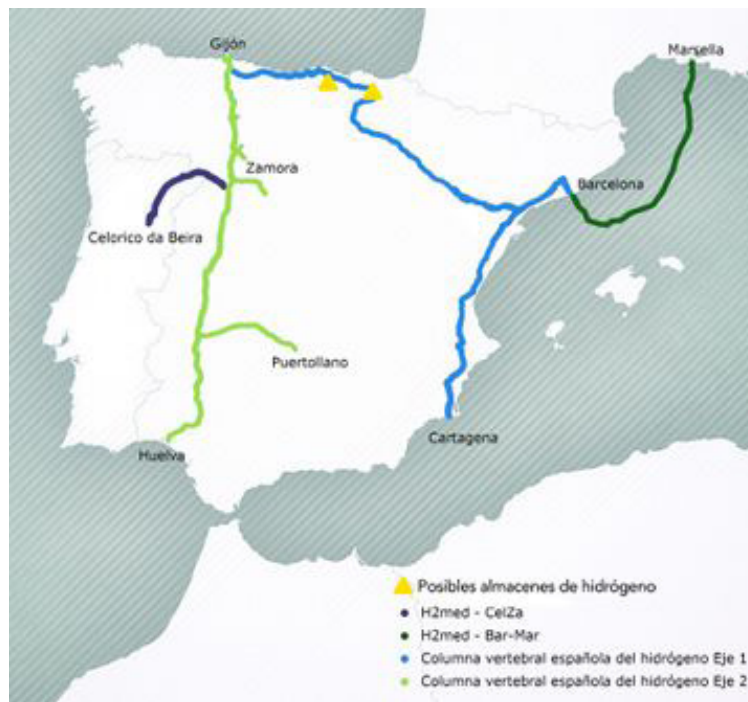
Figura 2. Proyecto BarMar o H 2 Med, que se unirá con Alemania para el transporte de hidrógeno [12].

El operador de importación y transportador de gas natural surcoreano KOGAS, uno de los mayores importadores mundiales de Gas Natural Licuado–LNG, contrató con DNV la evaluación de sus gasoductos usados, 5.000 Km, para definir si es posible transportar la mezcla de gas natural – hidrógeno y/o solo el gas hidrógeno. El trabajo incluye la evaluación del impacto de la mezcla en el sistema, averiguar si se requieren facilidades y equipos de compresión, inyección del H 2 en la operación, verificación de la calidad de la mezcla, potenciales usuarios de la mezcla, incluido el uso doméstico [13].